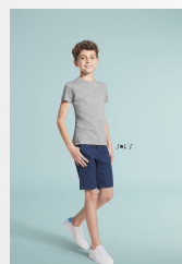
REGENT FIT KIDS 01183