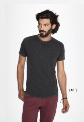
REGENT FIT 00553